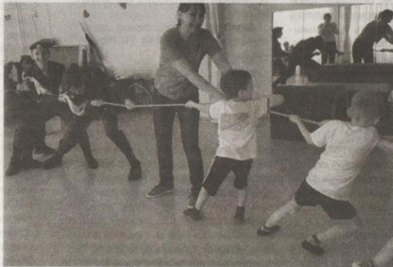
«Лисички», «зайчики» и «солнышки» вовсю старались победить курсантов