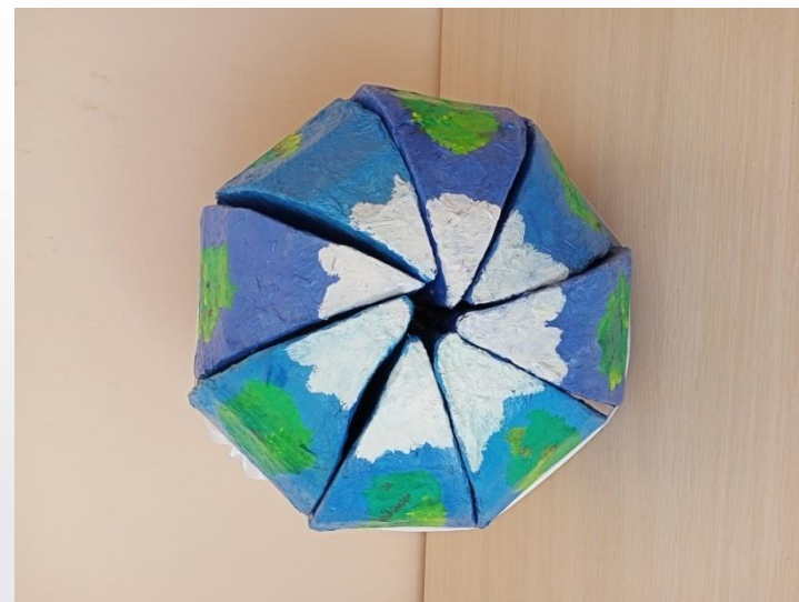
Макет «Земной шар»