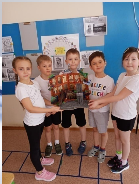
Макет «Огонь памяти»