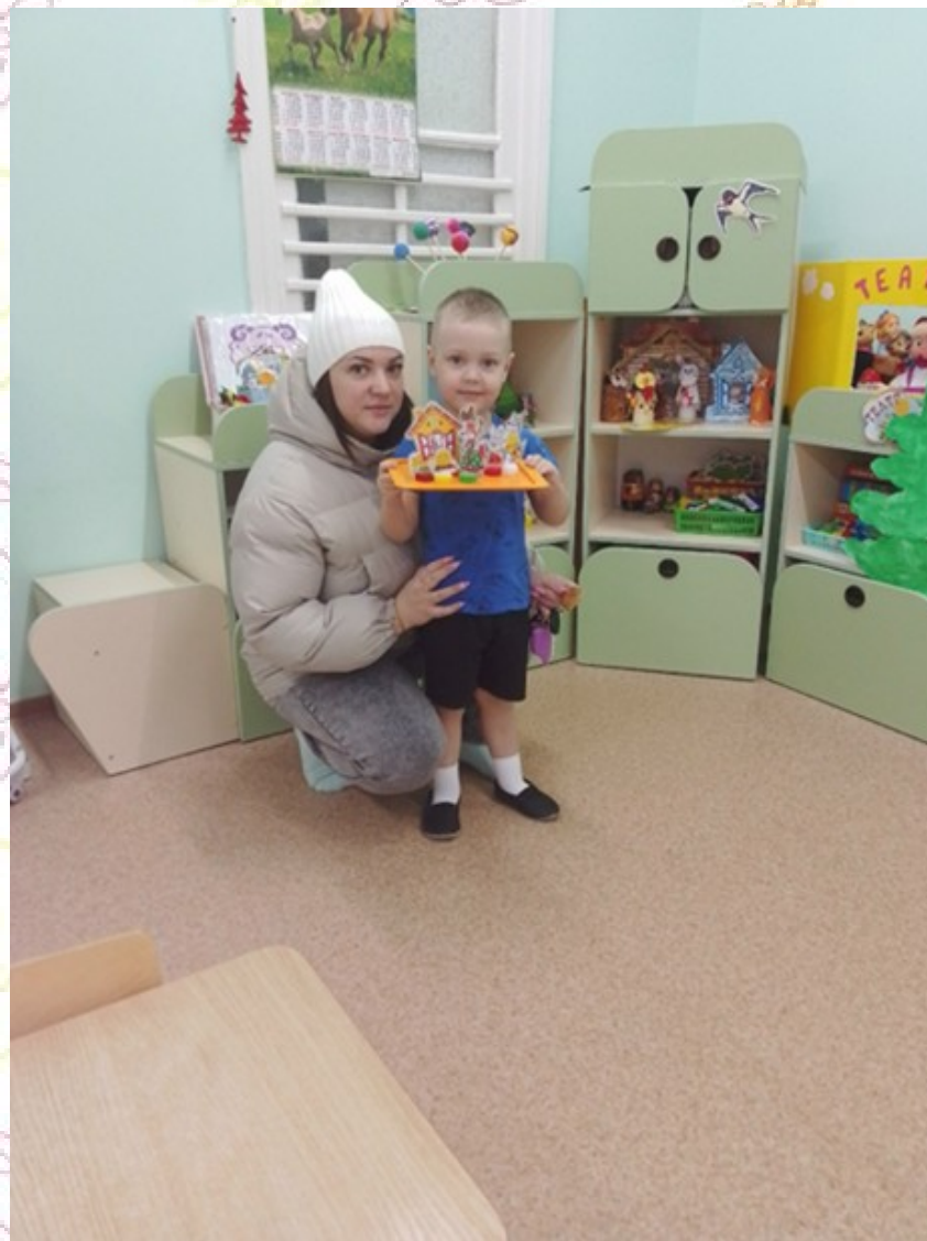
Театр из крышек