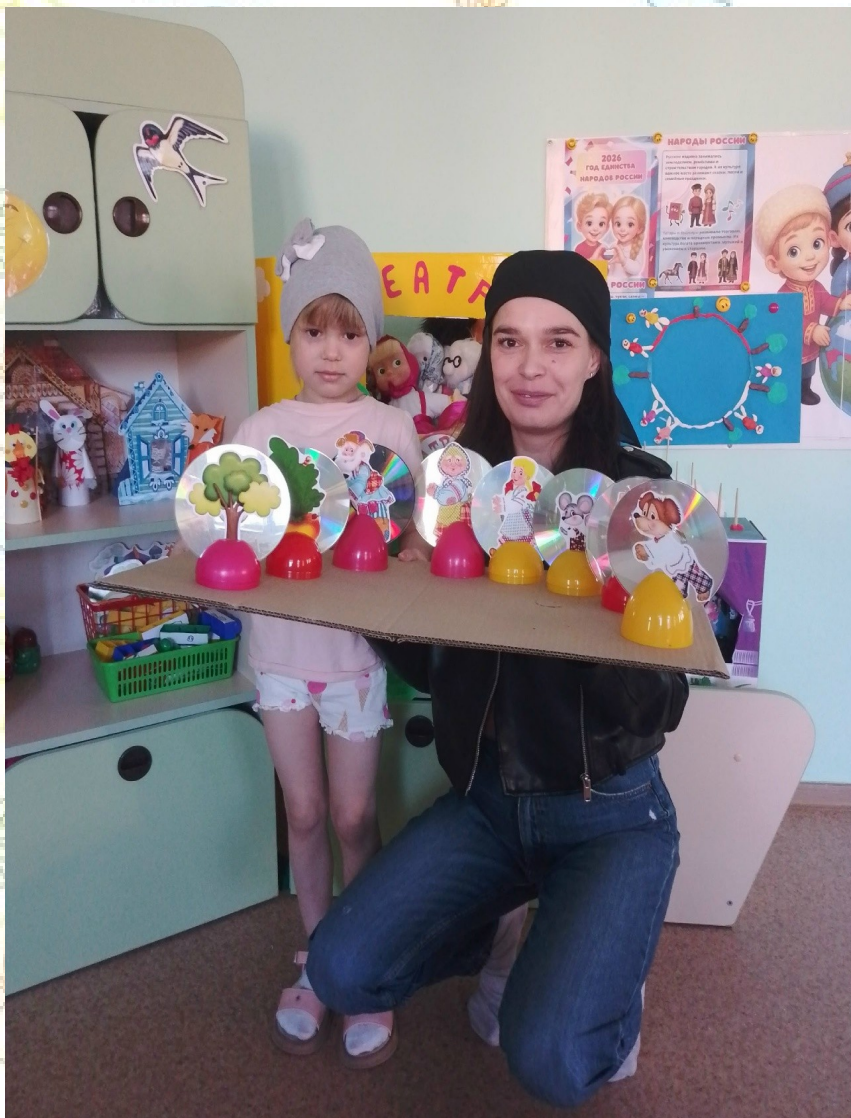
Театр на дисках