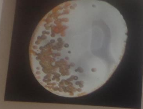
Sinarski polycentric (tubular) agate 0.051 x 0.040