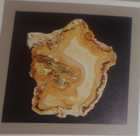
18 Sinarski krasisagate 0.058 x 0.061