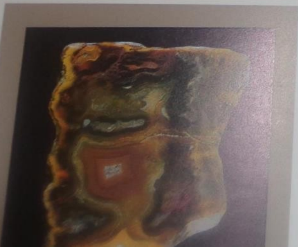
19 Sinarski krasisagate 0.061 x 0.057